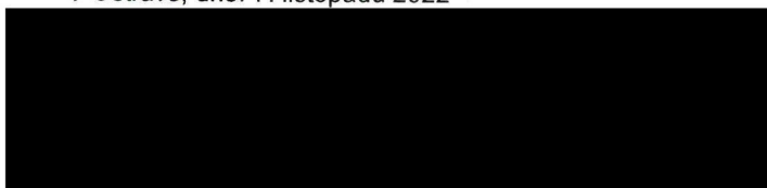
dodavatel razítko a podpis zástupce