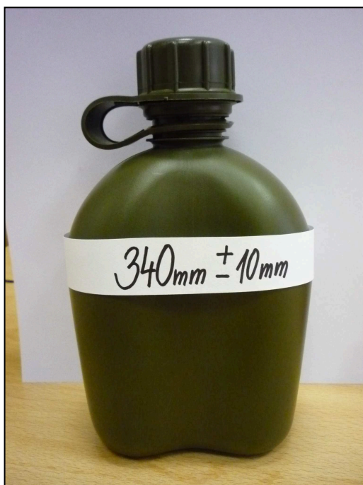
Vzorová fotografie č. 3