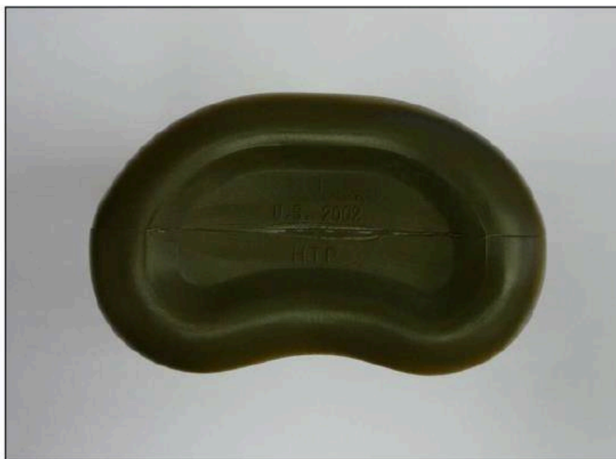
Vzorová fotografie č. 5