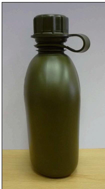
Vzorová fotografie č. 2