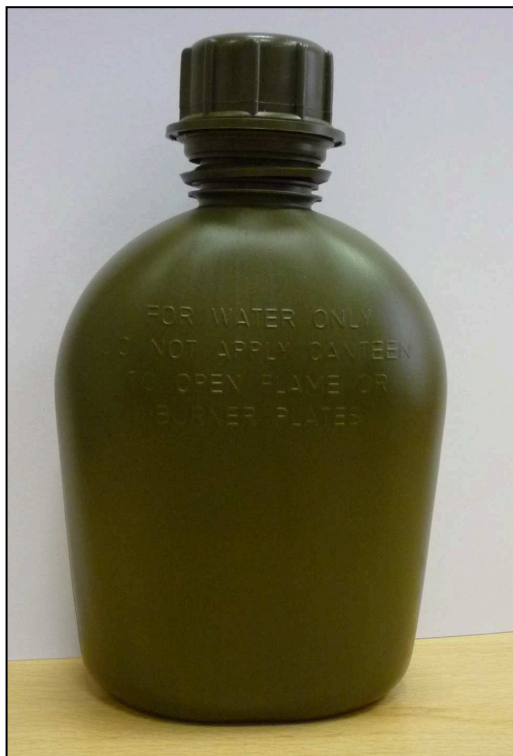
Vzorová fotografie č. 1