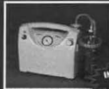
MEVACS M36, MEVACS M46

Электронные отсасыватели медицинские - микропроцессором обеспечено точное управление вакуума. Они оснащены микропроцессором, который позволяет точно регулировать мощность всасывания и автоматически отключать прибор при достижении заданной мощности всасывания.