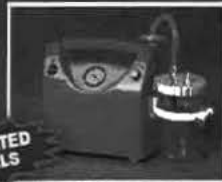
MEVACS M20, MEVACS M30

Отсасыватели медицинские с высокой мощностью отсасывания для хирургии. Они предназначены для отсасывания крови и других жидкостей из раны или хирургического поля. Имеют высокую емкость резервуара и высокую мощность всасывания.