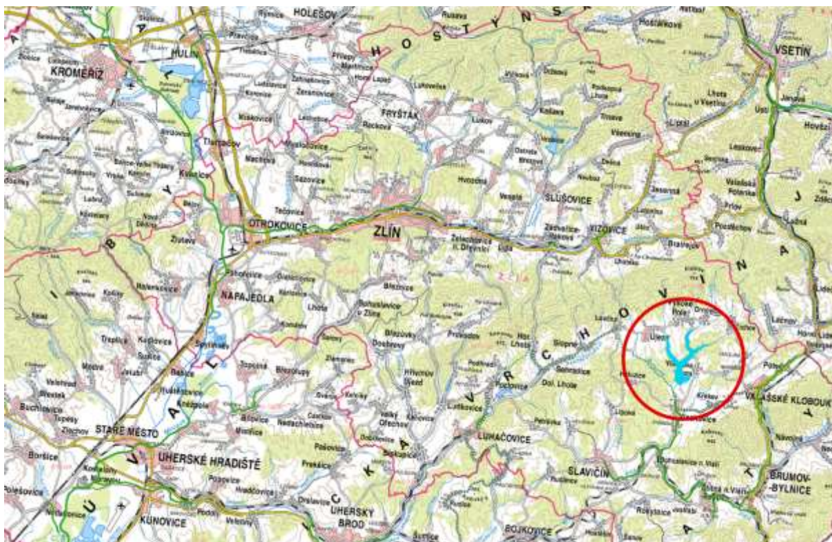
Obrázek 1: Zájmové území