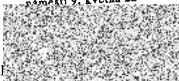
ředitel za pronajímatele

Střední škola André Citroëna Boskovice, příspěvková organizace náměstí 9. května 2a