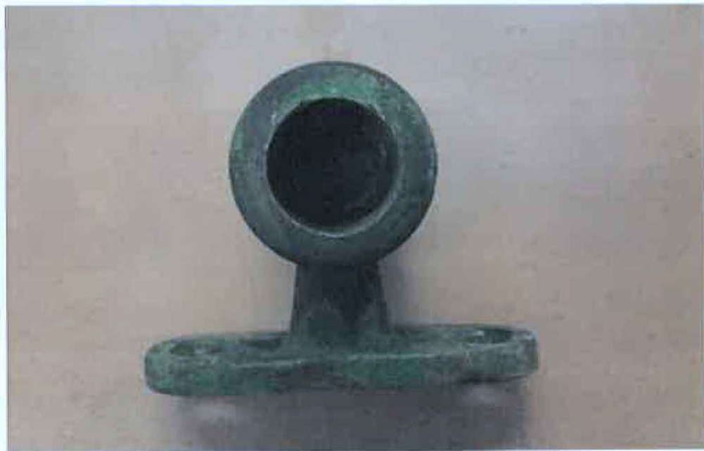
Pohled na soustružený otvor.