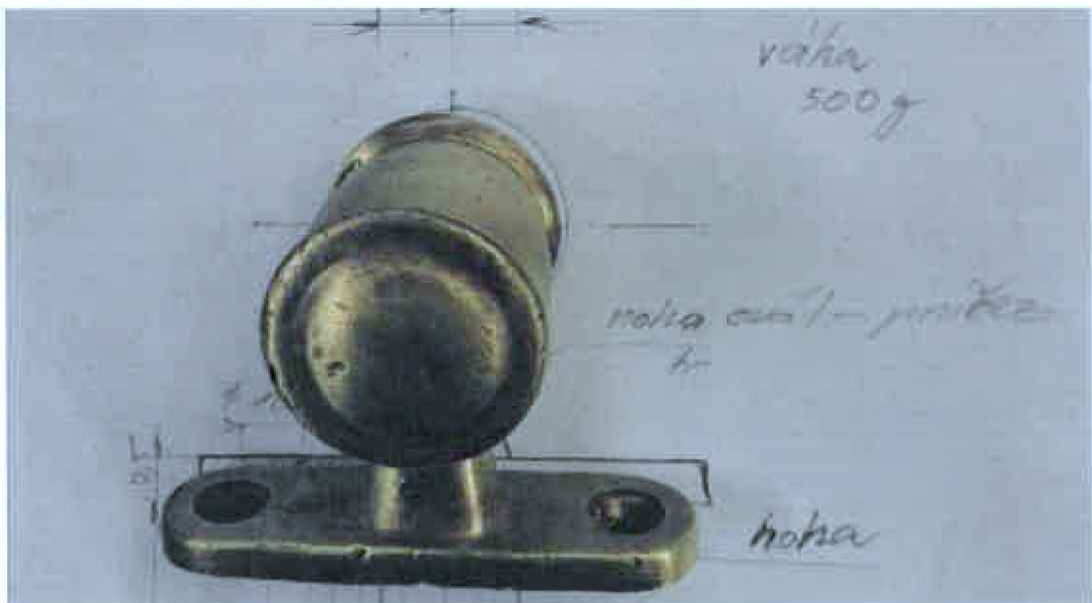
Jiný pohľad - bez náteru.