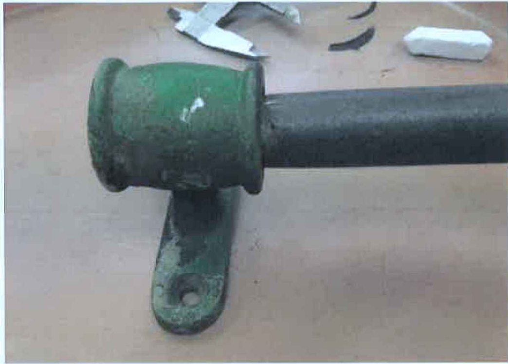
Pohled na konzoli, ještě v nátěru.

Popis výrobku : jedná se o konzole pro upevnění tyče pro okenní záclony do vlaku. Materiál konzole je žlutá mosaz, otvor pro trubku o průměru 27 mm. Váha konzole po opracování činí 512 gramů. Povrchová úprava dle originálu.