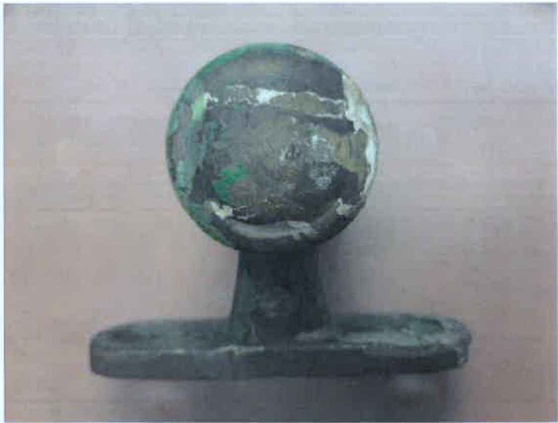
Druhá strana – válcové zakončení.