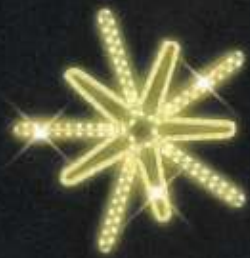
Dekor C10 v. 65 x š. 63 cm