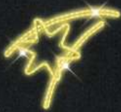
Dekor C16 v. 68 x š. 58 cm