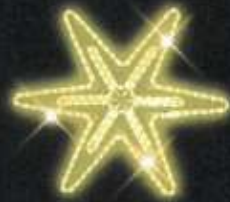
Dekor C8 v. 67 x š. 67 cm