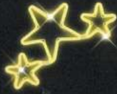
Dekor C17 v. 60 x š. 52 cm