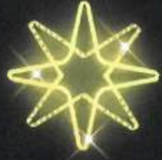
Dekor C19 v. 61 x š. 61 cm