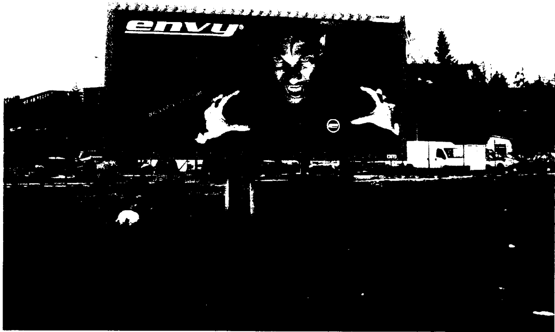
VRP č. 2