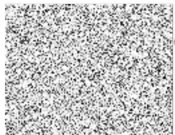
Podpis a razítko kupujícího