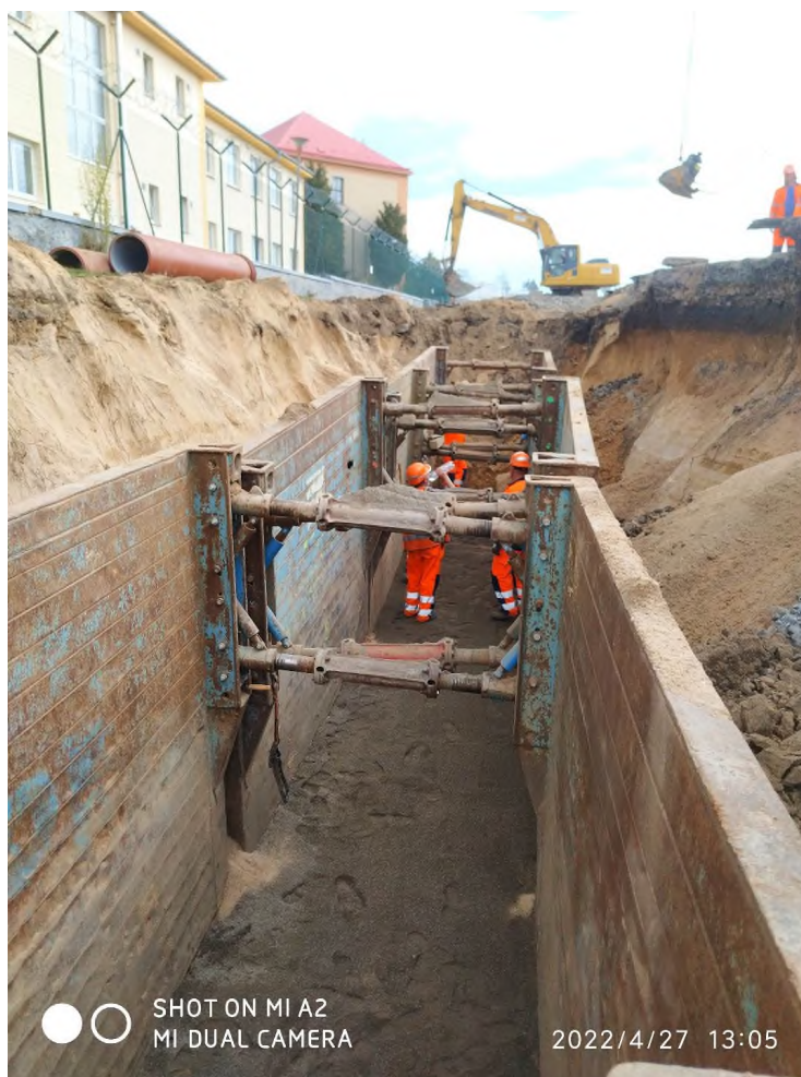
Obr. 2 Fotodokumentace zabezpečení výkopu pažícími boxy.