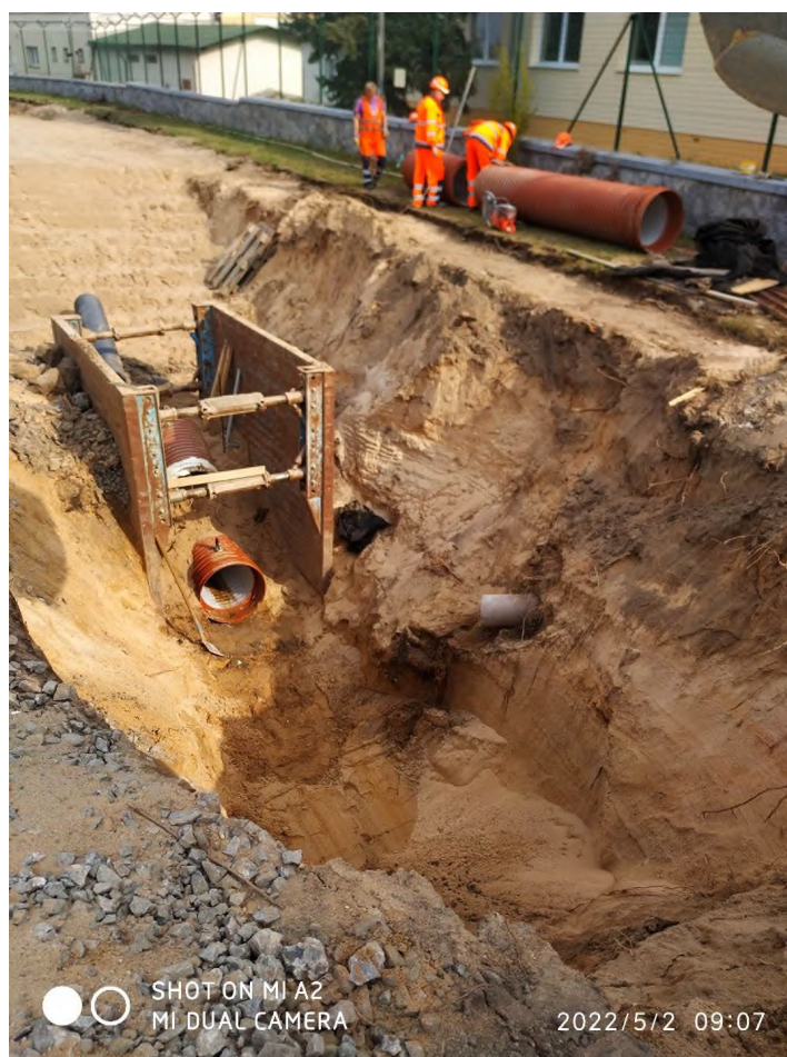
Obr. 1 Fotodokumentace výkopu

Výkopový materiál je I třídy těžitelnosti s vyšší abrazí na výkopové nástroje.