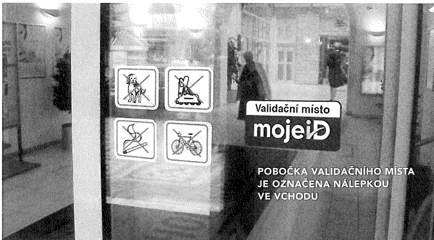
POBOČKA VALIDAČNÍHO MÍSTA JE OZNAČENA NÁLEPKOU VE VCHODU