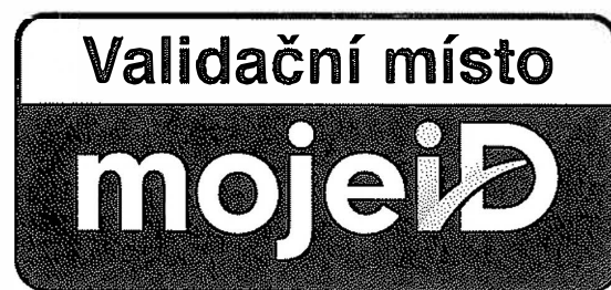
LOGO VALIDAČNÍHO MÍSTA