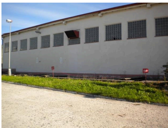
Fotografie č.1 – budova myčky s lapolem