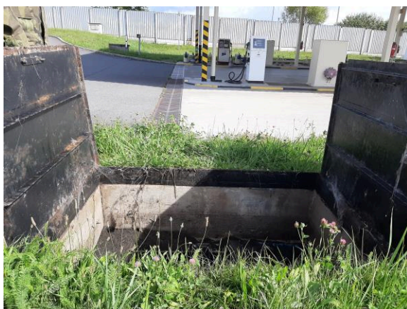
Fotografie č.3 – lapol u PHM