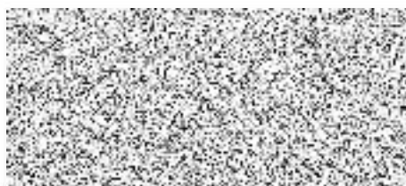
za Gymnázium, Pardubice, Mozartova 449