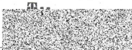
T-Mobile Czech Republic a.s. (dodavatel)