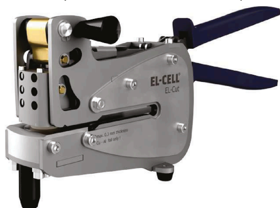
Obrázek 1 vysekávací kleště – „Cutting Pliers

Předmětem nabídky jsou vysoce přesný vysekávací nástroj - vysekávací kleště – „Cutting Pliers 18 mm, výrobce EL-Cell GmbH, Tempowerkring 8, 21079 Hamburg – Germany, viz Obrázek 1.