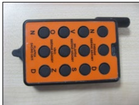
Obr.11. bezdrátový ovladač sklápění kontejneru na smetky