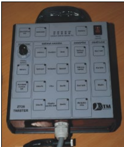
Obr. 10 : Ovládací pult v kabině traktoru