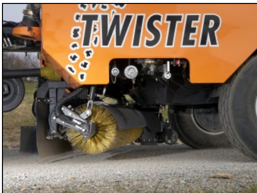
Obr.4 : Válcový kartáč