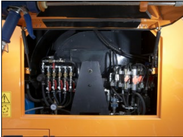
Obr.9 : Snadný přístup k prvkům hydraulického a vodního hospodářství