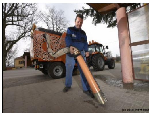
Obr.8: použití ruční sací hadice