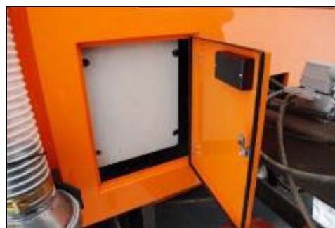
Obr.13: Přístup k hlavnímu el. rozvaděči zametače