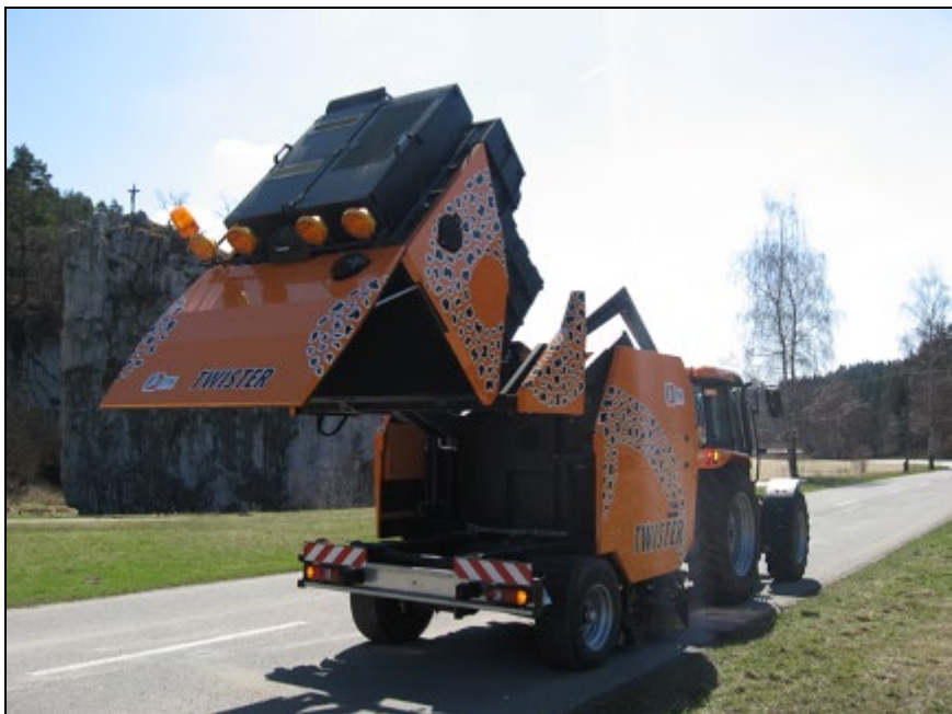
Obr.3 : zametač ZT 25 – vyklápění kontejneru smetků

Rychlovýměnný systém zajišťuje rychlé připojení a odpojení. Válcový kartáč spolu s jedním rotačním kartáčem společně přivádějí nečistoty k sacímu ústí zametače. Nečistoty jsou dále díky výkonnému ventilátoru nasávány do zásobníku odpadu. Ven odchází čistý vzduch přes roštový bezfiltrův systém odvodu. Zametač je dále vybaven skrápěcími tryskami kartáčů, sacího hrdla a sacího vedení, které skrápějí přiváděný prach. Trysky jsou ovládány z ovládacího pultu umístěného v kabině traktoru. Zametač je nesen na brzděné nápravě a celé zařízení jede v zákrytu za traktorem i v zatáčkách.