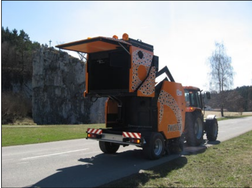
Obr.2: zametač ZT 25 –zvedání kontejneru smetků