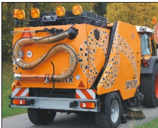
Obr.12: Uložení ruční hadice a pomocného nářadí