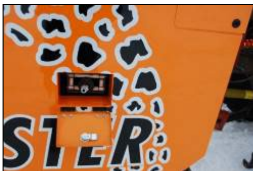
Obr. 14: Vyústění navijáku vysokotlaké hadice na boku zametače