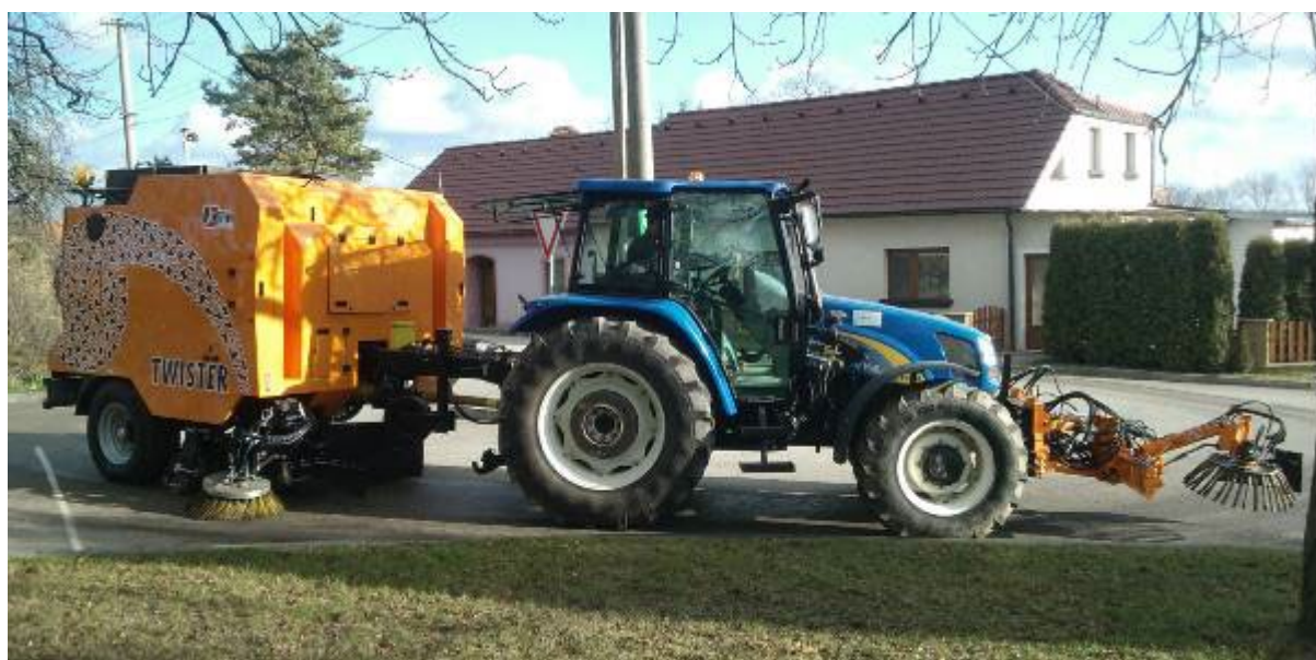
Obr.1 : vlečený traktorový zametač ZT 25 s předním kartáčem AKP 800

Výrobce MTM Tech, s.r.o., Česká republika