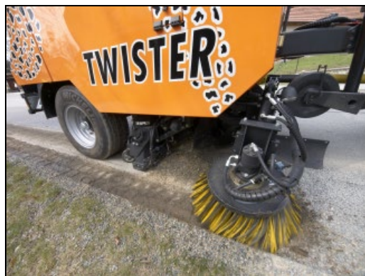
Obr.5 : Kruhový přimetací kartáč