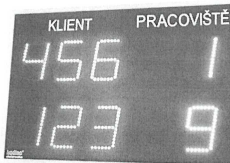
Předpokládaný rozměr cca 350 x 250 mm pro dva řádky

Organizační jednotka Odbor dopravy a silničního hospodářství – registr vozidel a registr řidičů se skládá ze tří pracovišť v 2. NP (viz nákres), přičemž na pracoviště 2 a 3 se z chodby vstupuje společnými dveřmi. Pracoviště 1 má vchod samostatný. Proto předpokládáme použití jednoho display-e se dvěma řádky (pro každé dveře), a ovládání ze všech tří počítačů, kdy počítače na pracovištích 2 a 3 ovládají na display-i jeden řádek, a PC na pracovišti 1 ovládá na display-i řádek druhý: