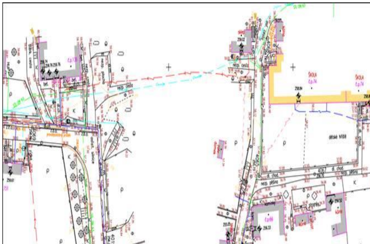
Příloha č. 1 – situační výkres