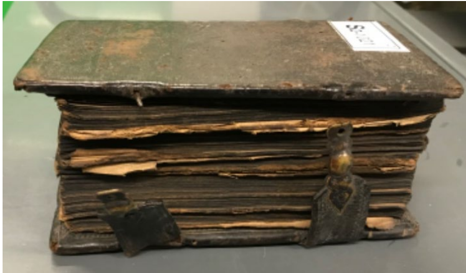
Pohled na přední ořízku knihy.