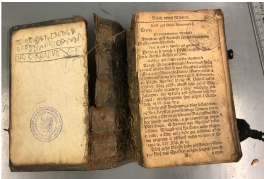
Pohled na první list knihy a přední přideštit.