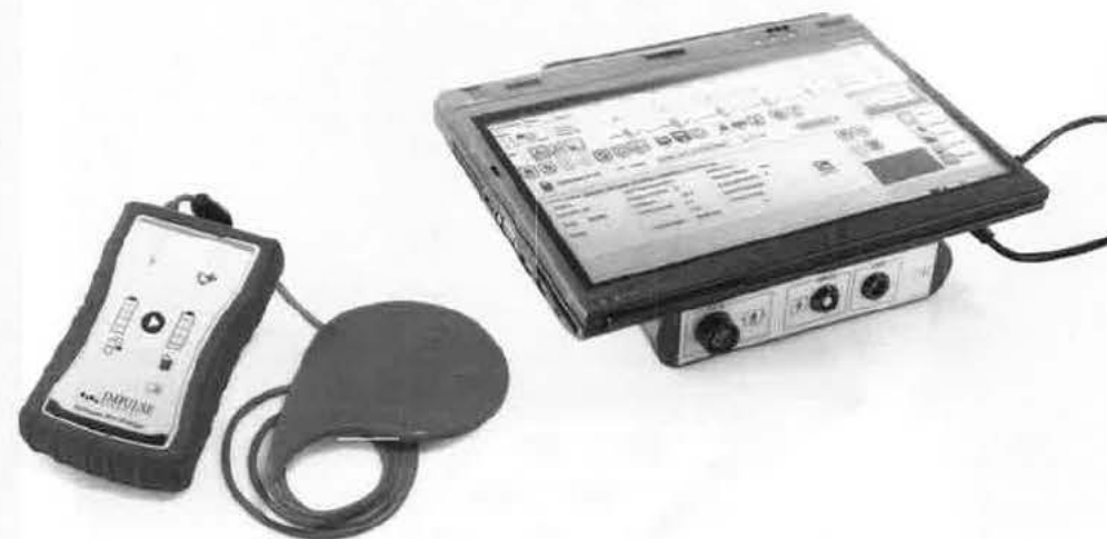
MINI CHARGER™ – Nabíječka