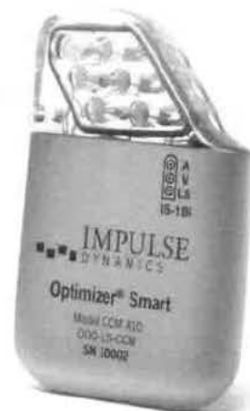
Pulzní Generátor Optimizer® Smart