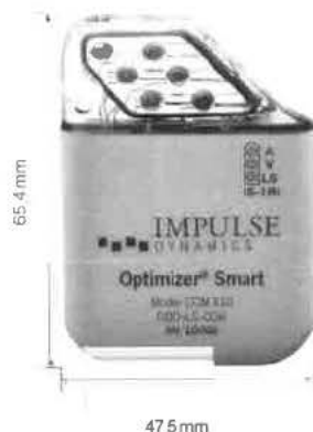
Optimizer® Smart 31.2 cm² / 48 g

Pulzní generátor Optimizer® Smart vysílá elektrické signály modulující srdeční kontraktilitu (Cardiac Contractility Modulation - CCM) pravé komory v průběhu absolutní refrakterní periody srdečního svalu. CCM dokáže podpořit sílu srdce ovlivněním fyziologických procesů probíhajících v srdečních buňkách.