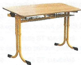
náklápění za příplatek 300,- Kč