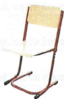
HD - zaoblené rohy