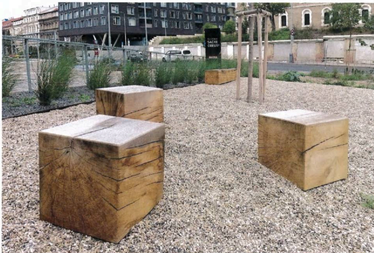
obrázek je pouze ilustrativní, nemusí přesně odpovídat popisovanému výrobku