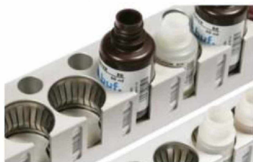
Stojánek pro reagensie