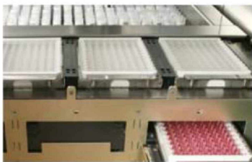
Pipetovací a inkubační modul