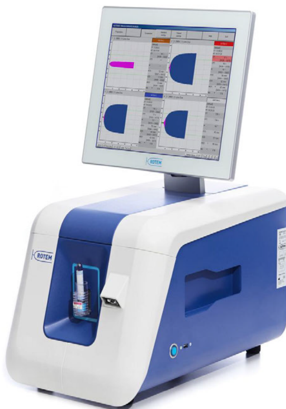
Fig. Thromboelastometry analyzer ROTEM® sigma

ROTEM® sigma haemostasis analyser – fully automated thromboelastometry system