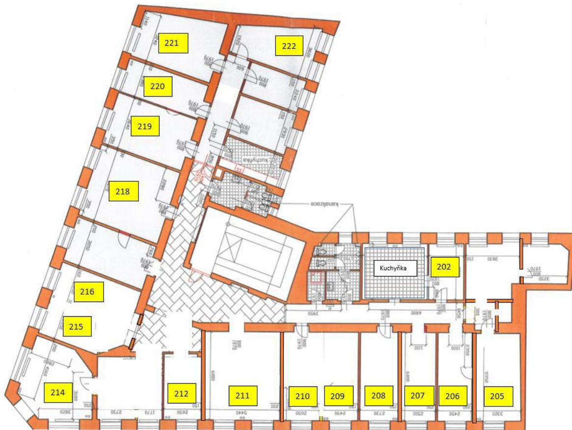
Schéma prostor s vyznačením čísel pronajatých kanceláří ve třetím nadzemním podlaží.

V příloze č. 1 k nájemní smlouvě se mění