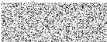
Správce rozpočtu souhlasí: