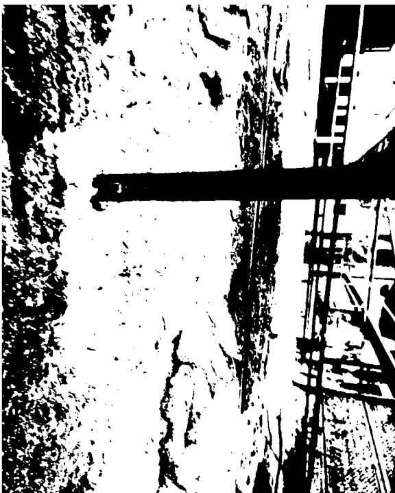
venkovní omítky ZL - 09