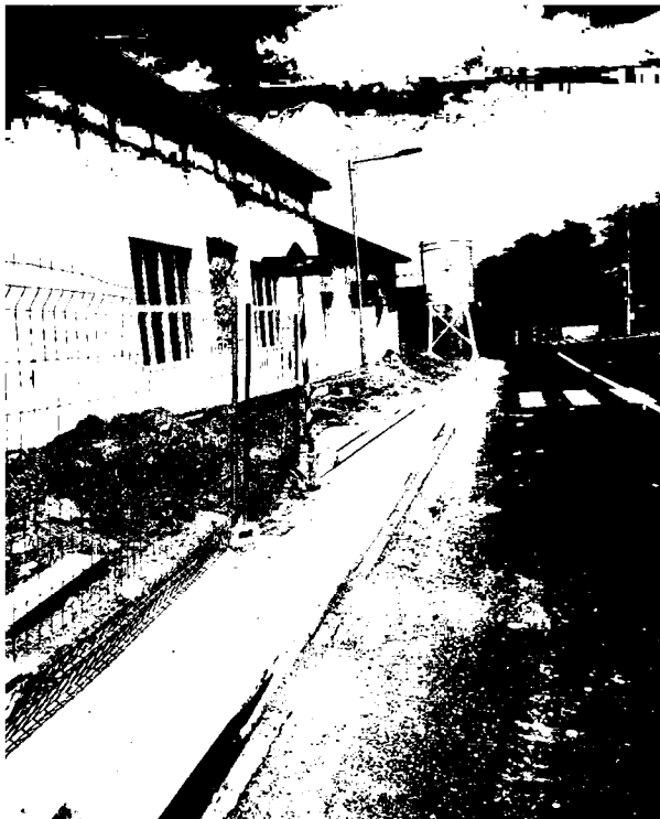
sokl zemní práce, zásypy ZL -17