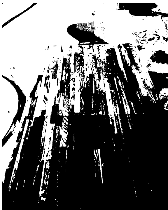
dřevěná podlaha ZL - 10