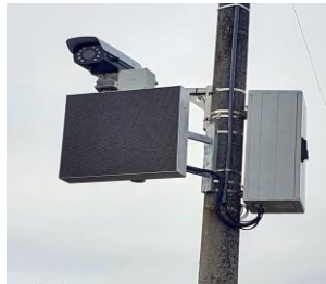
MP-KameraSPZ_v3, MP-Radar, MP-InfoTabule