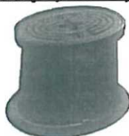
obj. č. 7.2.7 klasický uliční poklop hydrantový