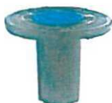
obj. č. 7.2.1 EURO uliční poklop kulatý