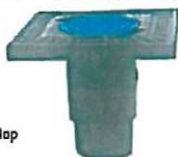
obj. č. 7.2.8 EURO uliční poklop čtvercový