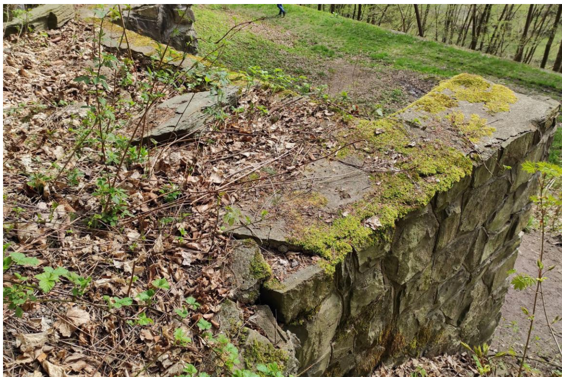
Foto 2,3 Rozvalené části opěrných pilířů, náletové dřeviny a propadlá horní část s rozlámanými kusy betonu