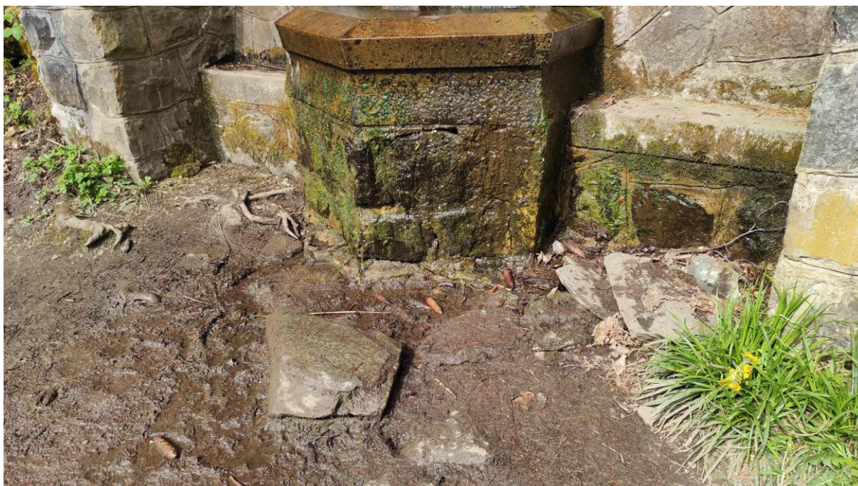
Foto 4 Situace pod přelivovou římsou. Počítáno je s vytvořením odtokového žlábků s překrytím plochými kameny. Žlábek bude pokračovat vlevo od Pramene, jímá vodu z přilehlého potůčku a následně bude odvádět vodu pod cestou dále ze svahu.