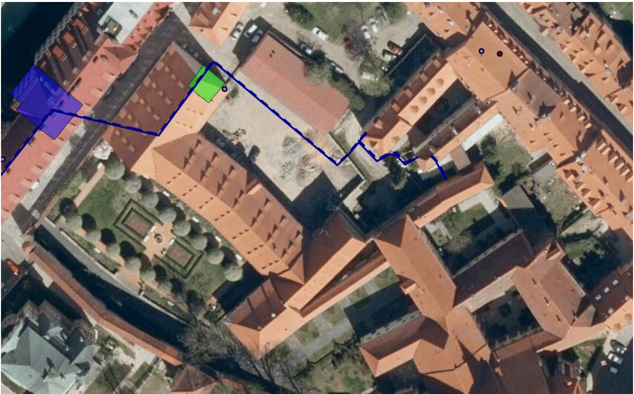
Obrázek č. 1

Dodavatel – obchodní společnost TERE A Cheb s.r.o., je v souladu s licenci pro výrobu tepla a licenci pro rozvod tepla oprávněna poskytovat služby spojené s výrobou tepla a dodávkami tepla v rámci komunální a průmyslové sféry. Má potřebné know-how, finanční, technické a personální kapacity pro provoz zařízení, která jsou předmětem této smlouvy.