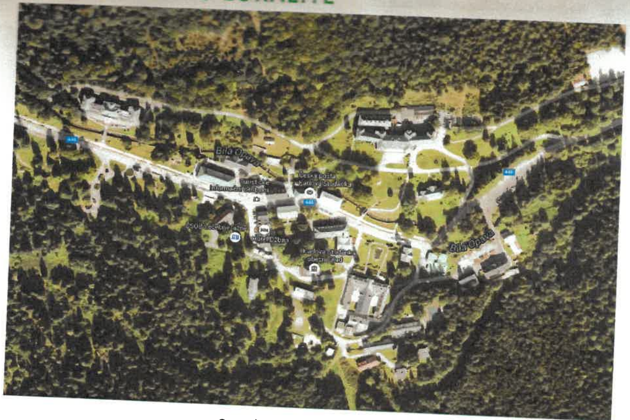
OBR. 1) CELKOVÝ POHLED NA AREÁL