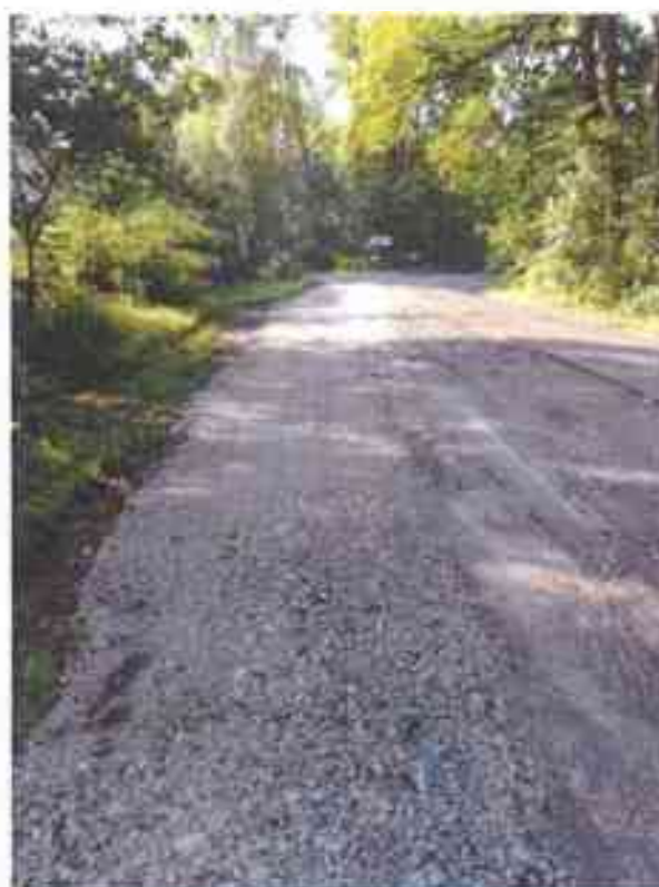
Foto sanovaných míst ze Štěrky