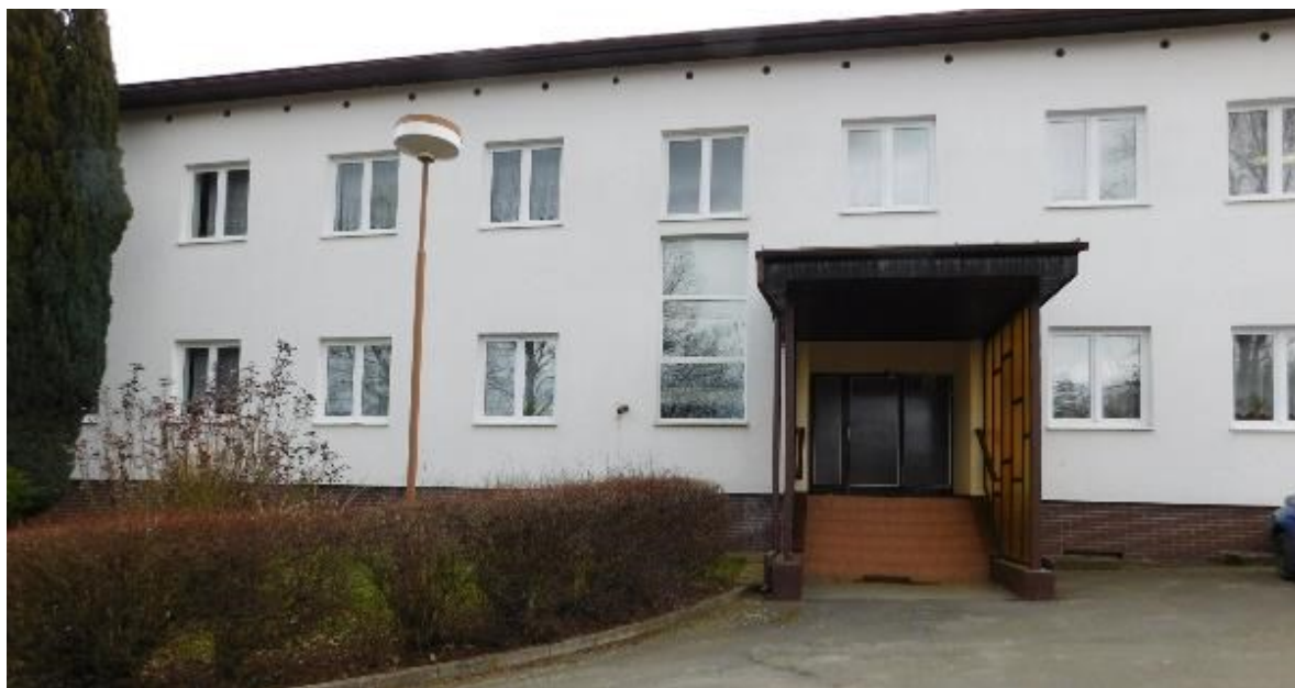
Foto vstupního přístřešku