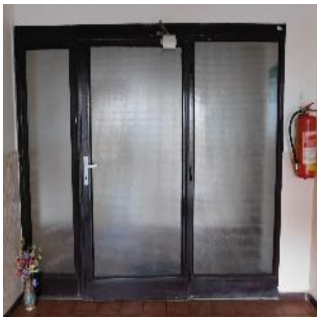
Foto vnějších vchodových dveří do zádveří