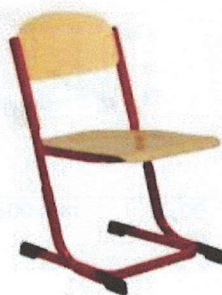
Židle EXP stavitelná