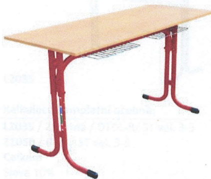
LAVICE EXP stavitelná