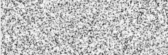
člen představenstva EXCON, a.s.