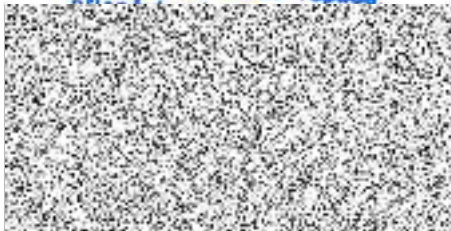
razítko a podpis odběratele

Základní škola, Bilina, Lidická 31/18, okres Teplice