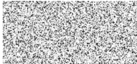
razítko a podpis dodavatele