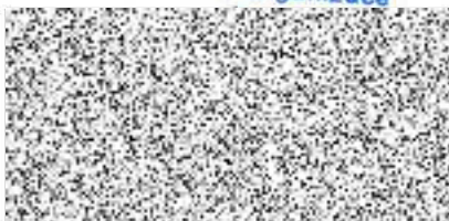
Razítko a podpis odběratele

Základní škola, Bílina, Lidická 31/18, okres Teplice, příspěvková organizace