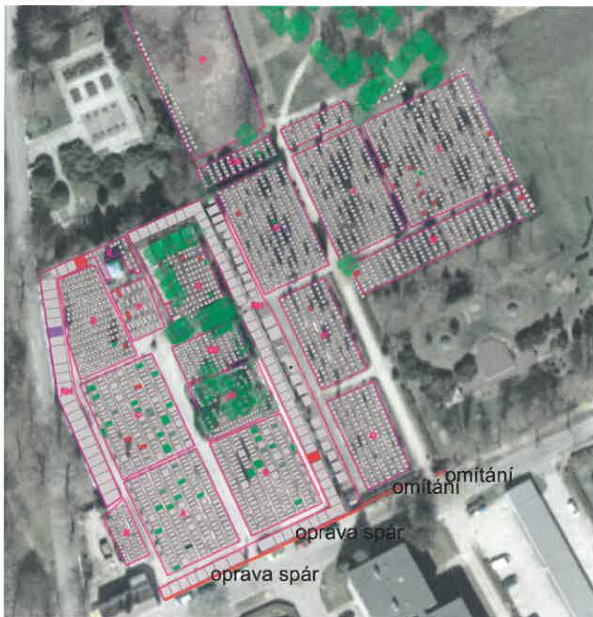
Příloha č. 2 – situace s orientačním vyznačením zdi a fotodokumentace