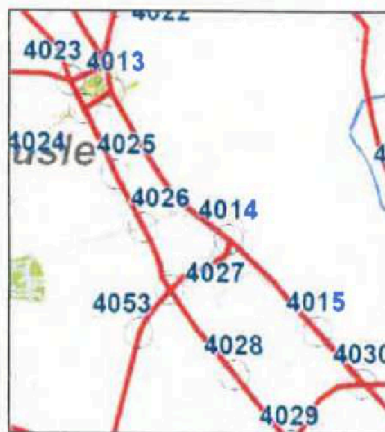
Obr. 1 - předpokládaný rozsah a podrobnost DIP (kartogram 2021)