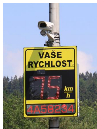
Ilustrační fotografie nabízeného ukazatele