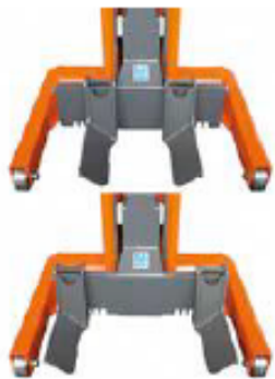
Nastavitelná zvedací vidlice