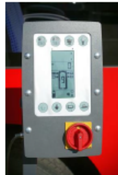
Centrální ovládání na sloupu pomocí LCD displeje

Popis sloupových zvedáků v bezdrátovém provedení: