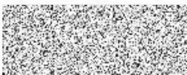
Školní statek, Opava, p.o. pronajímatel