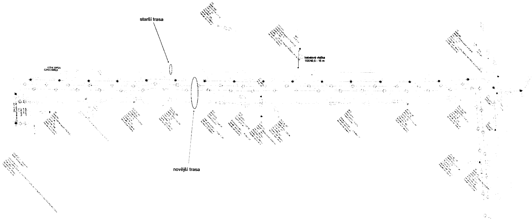
SCHÉMA MET+HDPE - druhý úsek