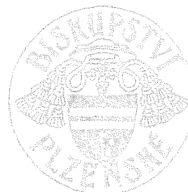
Mons. Tomáš Holub biskup plzeňský