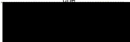
Miroslav Krčil starosta města