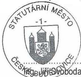
Mgr. Jiří Svoboda primátor statutárního města České Budějovice