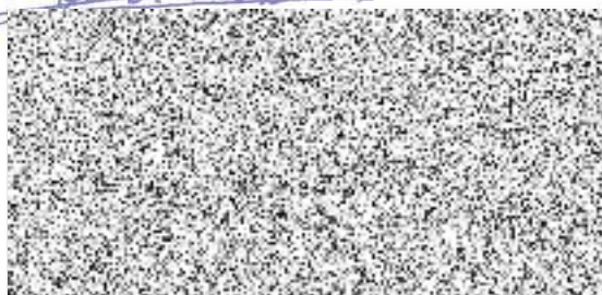
Tomáš Brokeš prokurista