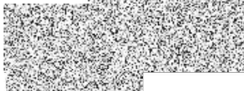
starosta města Vsetín