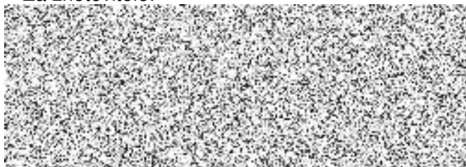
jednatel Tempoterm, spol. s r. o.

V Praze dne, viz el. podpis Za zhotovitele: