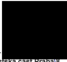
Městská část Praha 8 Ondřej Gros, starosta